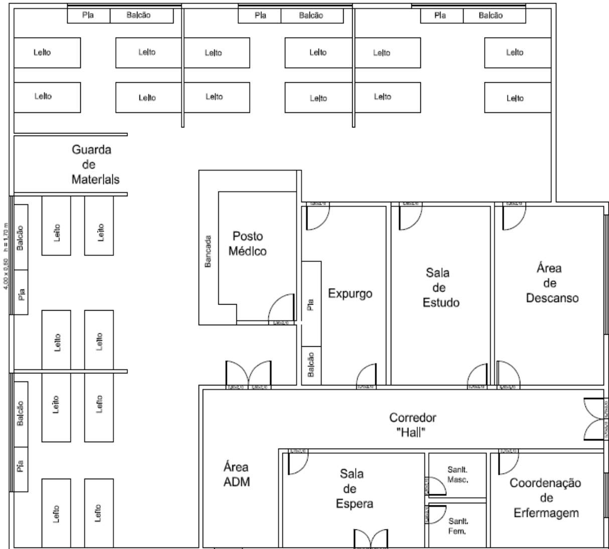
Figura 2 – Planta baixa da UTIN