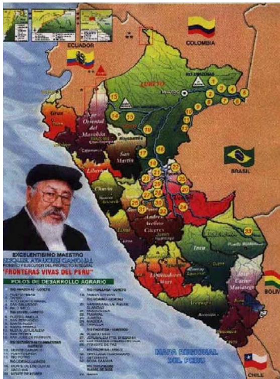
Mapa n° 3 Difusión de la AEMINPU en Perú y en las fronteras con Colombia y Brasil.