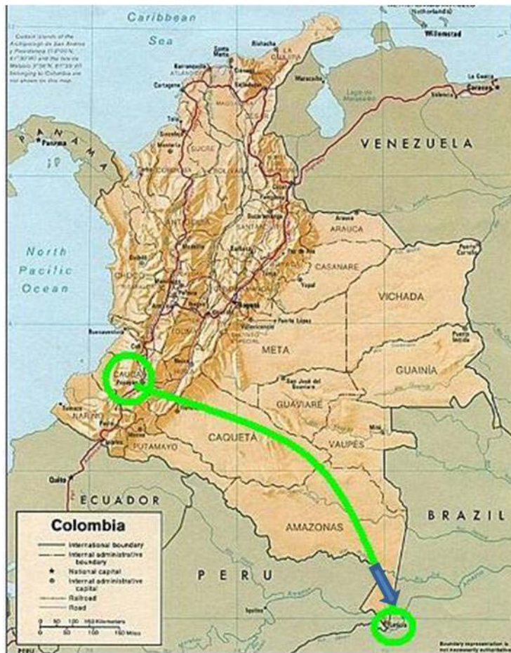
Mapa nº2 Migración de las familias israelitas del Cauca al Amazonas

Adaptado de http://www.embajadacolombia.ca/en/images/mapa_colombia.jpg , consultada en noviembre de 2008