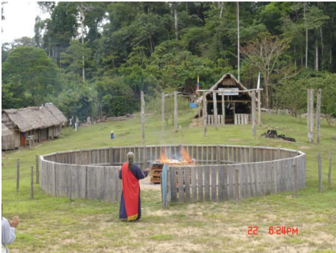
Foto nº7. Sacerdote en frente al altar con la ofrenda. La iglesia al fondo.

También conocida como holocausto, la ofrenda es el acto mediante el cual se hace un ofrecimiento a Dios el cual incluye la incineración de un animal puro y de panes sin levadura. Éstos son colocados en un altar el cual se encuentra ubicado a 22 m de la puerta del templo, al aire libre. El sacrificio era parte obligatoria, esencial y muy elaborada del judaísmo hasta la destrucción del templo de Jerusalén en el 70 d.C. Entre los muchos ritos de sacrificio del antiguo judaísmo se cuentan los de acción de gracias y expiación de los pecados.