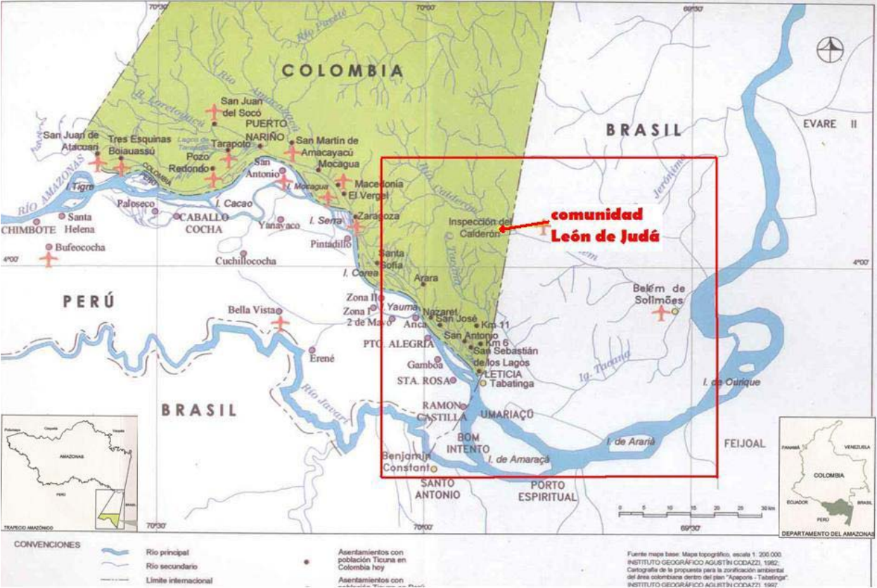
Adaptado de Riaño Elizabeth. (2003). Organizando su espacio, construyendo su territorio: transformaciones de los asentamientos Ticuna en la ribera del Amazonas colombiano, Bogotá, Unibiblos. Mapa n°13.