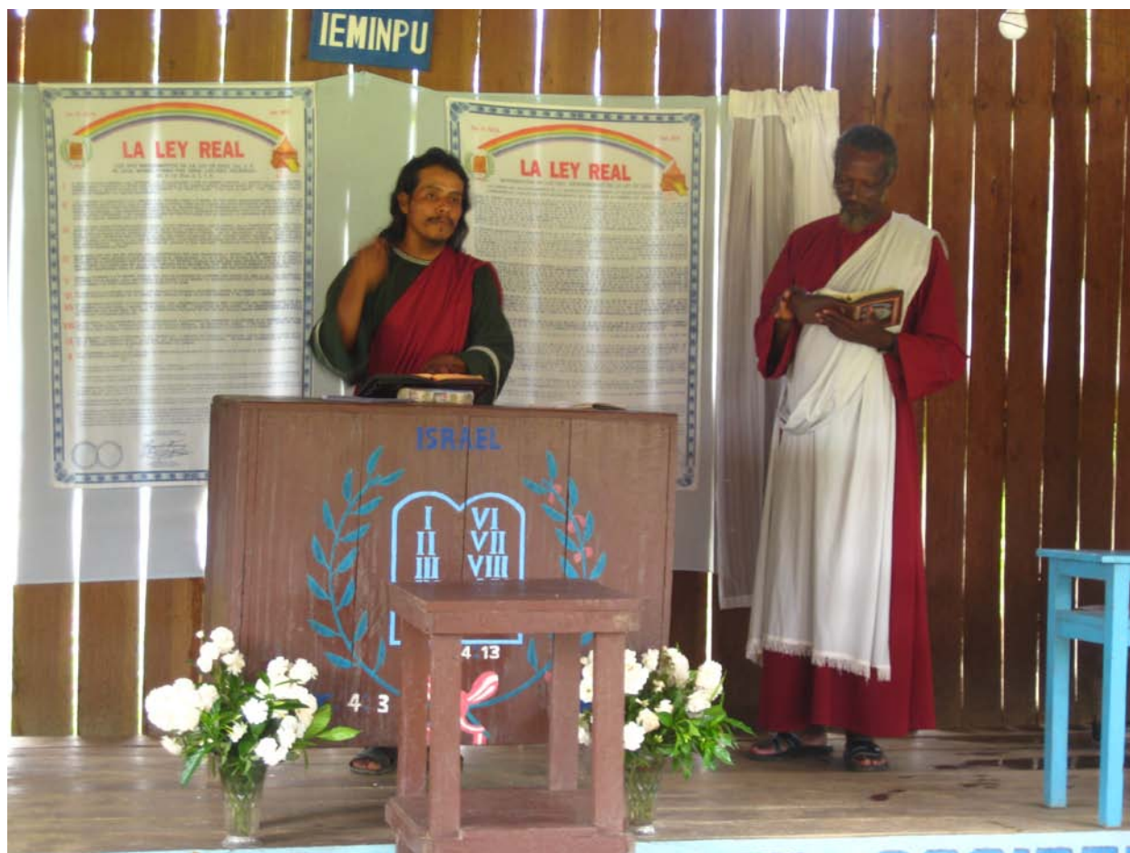
Foto nº6. Hermanos en el púlpito con La ley real al fondo.