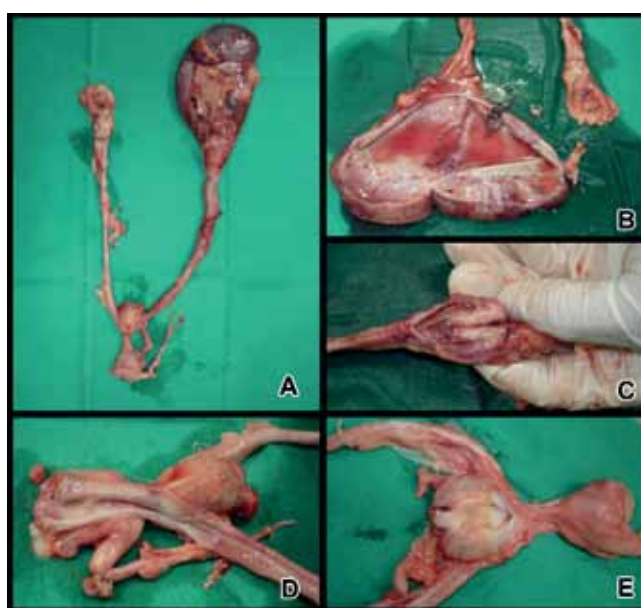
Figura 3: Aspectos macroscópicos do trato urinário da cadela Husky Siberiana. A - Rim esquerdo e o terço cranial do ureter esquerdo com acentuada dilatação. Bexiga retraída e diminuída. Rim direito amorfo e diminuído de volume (C). Em B, rim esquerdo dilatado, aberto, com conteúdo serosanguinolento e atrofia compressiva das regiões medular e cortical. D - Ambos os ureteres apresentaram terço final ectópico com fixação extramural e inserção na porção cranial da uretra. E - A bexiga retraída medindo 2,0 cm de diâmetro, consistente, desprovida de urina e com pontos de hemorragia na mucosa.

Macroscopicamente, o rim e o segmento cranial do ureter esquerdo mostraram acentuada dilatação, medindo 13 cm de diâmetro, apresentando conteúdo líquido serosanguinolento e atrofia compressiva das regiões medular e cortical. Também foram observadas no ureter esquerdo duas áreas de estenose com 1,0 e 3,0 cm de extensão. O rim direito apresentava alterações significativas de sua morfologia, medindo 1,5 cm de diâmetro e com consistência firme. À secção havia escasso parênquima renal e discreta dilatação cística da pelve. O ureter direito apresentou dilatação no terço cranial e consistência firme. Ambos os ureteres apresentaram terço final ectópico com fixação extramural e inserção no segmento cranial da uretra. A bexiga apresentou-se retraída medindo 2,0 cm de diâmetro, consistente, desprovida de urina e com pontos de hemorragia na mucosa (Figura 3).