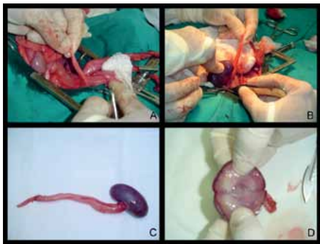
Figura 2: Sequência fotográfica mostrando procedimento cirúrgico para laparotomia exploratória e nefroureterectomia na cadela poodle. A - Identificação da ectopia ureteral unilateral intramural com abertura na uretra. B - Exposição do rim direito e dissecação da pelve renal. C - Aspecto macroscópico do rim e ureter direito após exérese. Observa-se congestão do parênquima renal com perda da lobulação superficial. Dilatação do ureter. D. Aspecto macroscópico da pelve renal após secção do parênquima renal. Observa-se pelve renal dilatada.

(Figura 2). Foi prescrito trissulfim 3 na dose de 15mg/Kg, via oral, a cada 12 horas, por 7 dias consecutivos; maxicam 4 na dose de 0,2 mg/Kg, via oral, a cada 24 horas, por 3 dias consecutivos; e tramadol 5 na dose de 4 mg/Kg, via oral, a cada 8 horas, por 2 dias consecutivos. Oito dias após o procedimento cirúrgico, foram retirados os pontos e constatou-se que o animal estava urinando normalmente, não apresentando mais incontinência urinária.