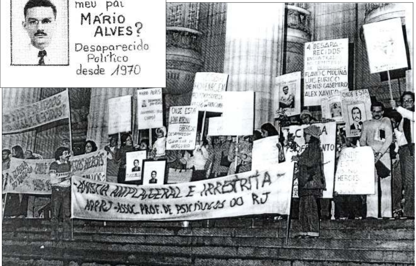
O desfecho trágico: mãe e filha em busca do corpo de Mário.