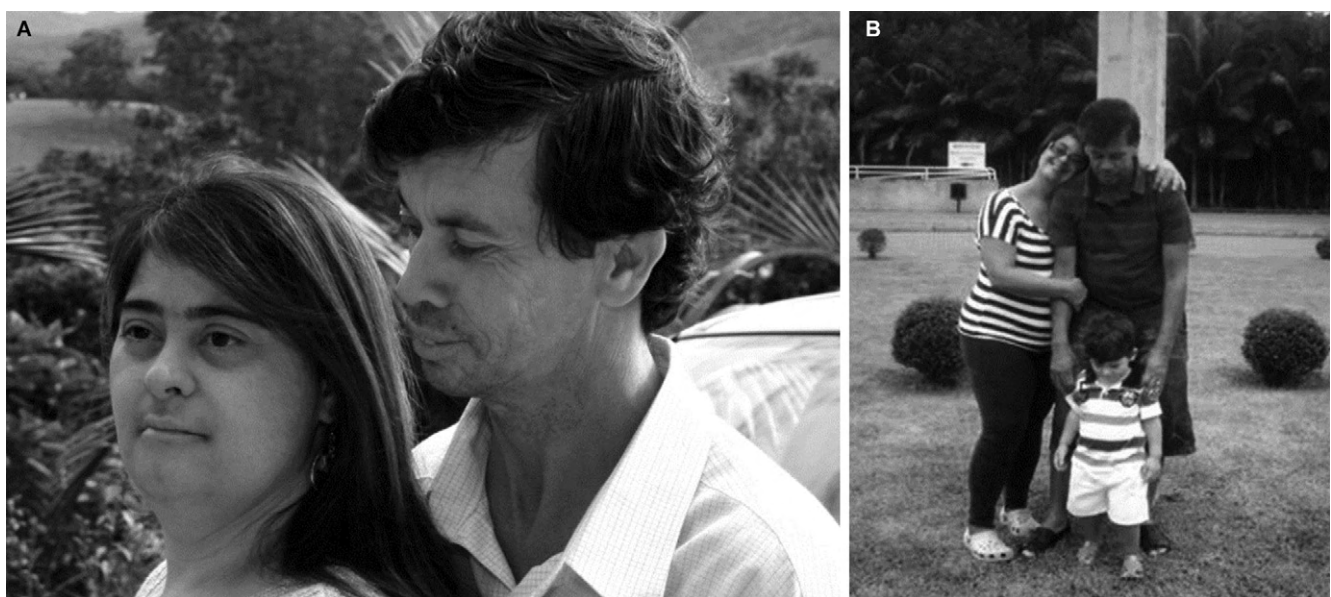
Figura 1 Pareja al inicio de la relación (A) y reunión de la familia (B).

Actualmente, según el caso, la sexualidad es más aceptada por los familiares de personas con el síndrome, pero el asunto de la reproducción se observa con precaución y un 70% de padres la consideran inviable 15 . En hombres con SD, a pesar del desarrollo normal de características sexuales secundarias, la fertilidad se reduce, posiblemente debido a comportamientos anómalos del cromosoma 21 en la meiosis