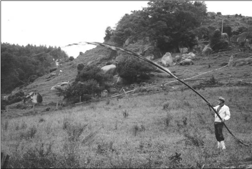
Figura 4 - Distribuição de dejetos em pastagem, com auxílio de sistema de bombeamento e tubulações. Bacia do rio Coruja-Bonito, jul/2003

Várias características fisiográficas e hidrológicas da bacia atuam como fatores endógenos, como condicionantes no processo de poluição, assim como a precipitação, que, como fator exógeno ( entrada no sistema), estabelece a comunicação entre o potencial poluente (dejetos) e as águas da rede de drenagem.