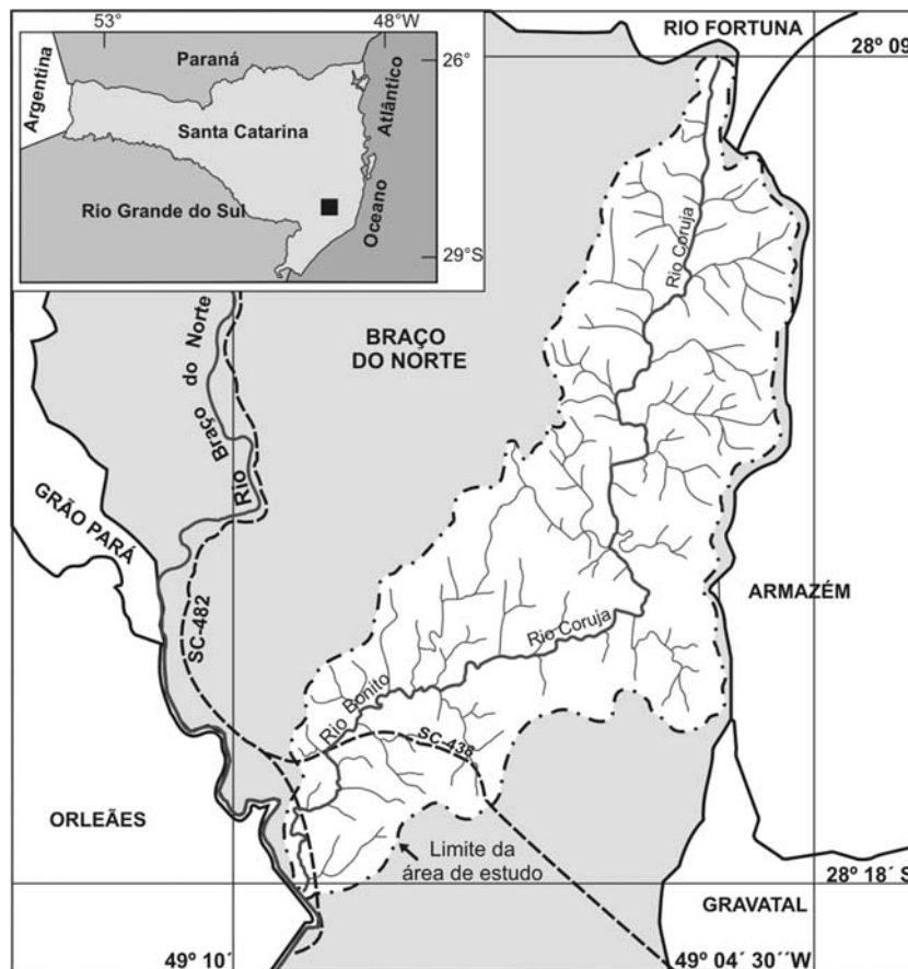
Figura 1 - Localização da sub-bacia do rio Coruja-Bonito no município de Braço do Norte, sul de Santa Catarina

Análises de água evidenciaram o comprometimento qualitativo do rio Coruja-Bonito, principalmente devido à suinocultura (HADLICH, 2004). A poluição decorre da estruturação e funcionamento dessa atividade, que podem ser analisados sob a ótica sistêmica.