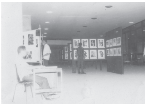
Figura 8 - Primeiro Salão Bahiano da Fotografia Contemporânea, no foyer do Teatro Castro Alves