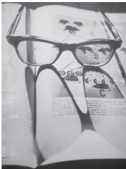
Figura 2 - Zoofobia