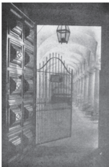
Figura 3 - Convite à paz