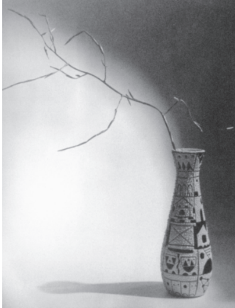
Figura 5 - Composição