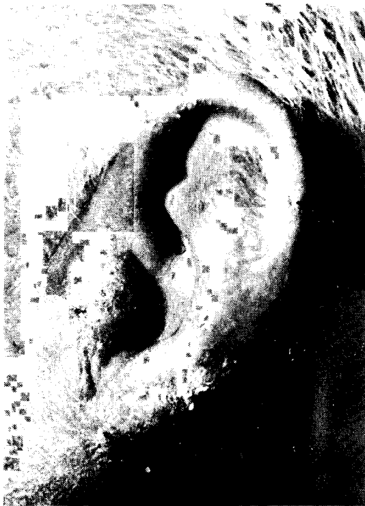
Fig. 1 - O pavilhão auricular apresenta, difusamente, lesão eritemato-descarnativa.

reação granulomatosa com células gigantes e epitelióides (Fig. 2). Algumas células gigantes continham elementos globosos, de paredes espessas e acastanhadas com septação única ou dupla. Material obtido do raspado das ulcerações, inoculado em meio de Sabouraud-dextrose-agar, deram crescimento a fungo demaciaceo. Cultivos em lâmina evidenciaram tratar-se de P. verrucosa . Foram feitas várias tentativas terapêuticas com melhora da lesão, mas não se obteve cura.