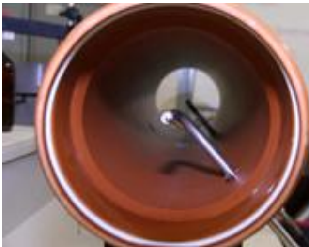
Figura 2 – Aspersor