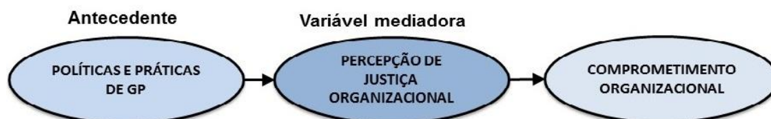
Figura 1 - Desenho conceitual geral da pesquisa - Influência da percepção das políticas e práticas de gestão de pessoas no comprometimento organizacional

A Figura 1 apresenta o desenho conceitual simplificado desta pesquisa, demonstrando a possível influência da percepção das políticas e práticas de gestão de pessoas e da percepção de justiça organizacional, como variável mediadora, no comprometimento organizacional.