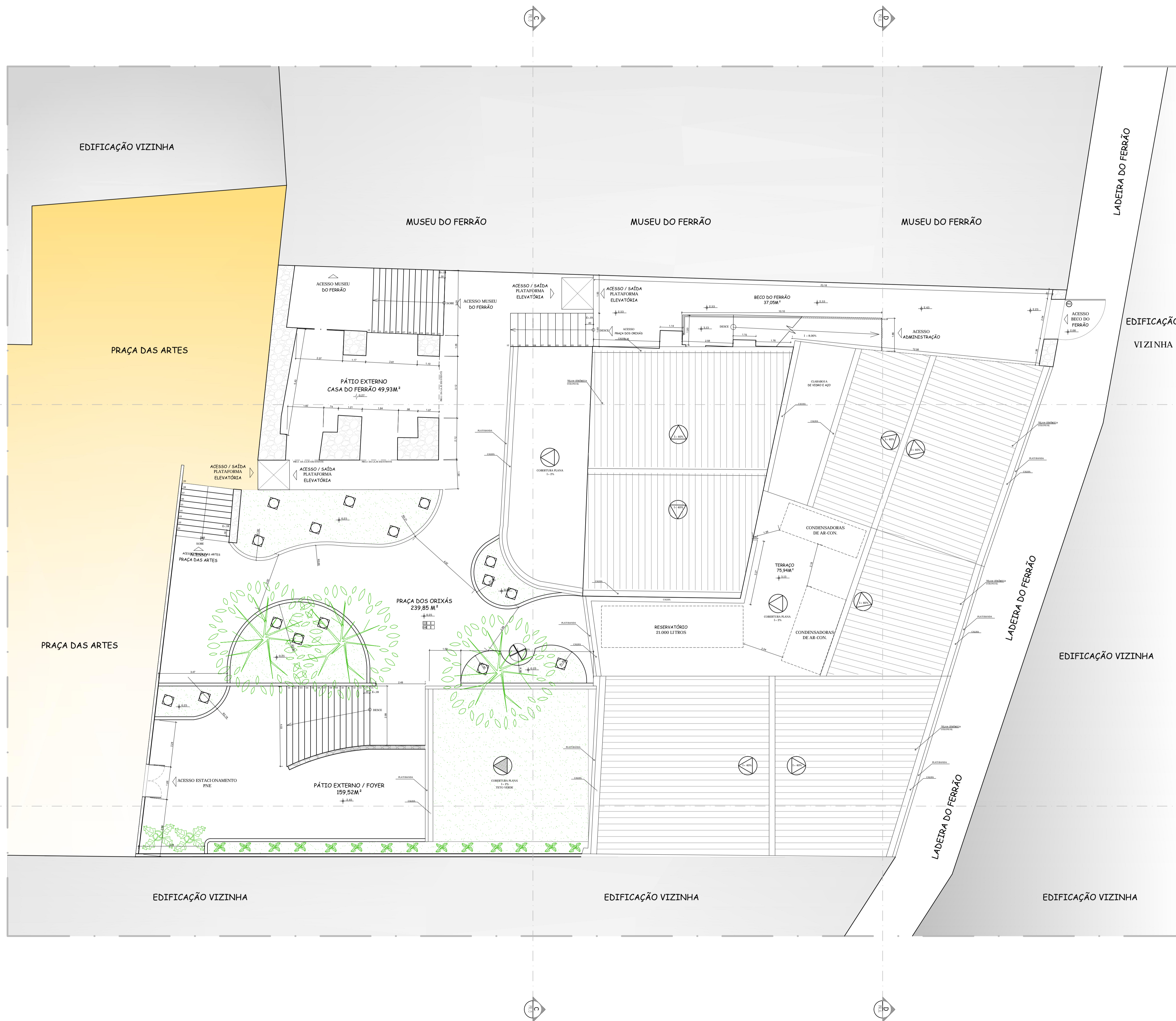
DETALHE ESQUEMÁTICO DO TETO VERDE