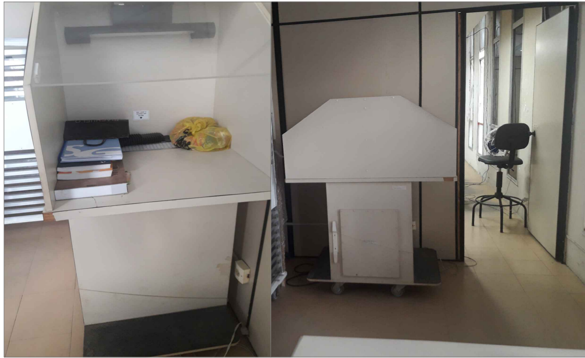
01 MAQUINA DE HIGENIZAÇÃO (1,20 x 0,80) H = 1,45