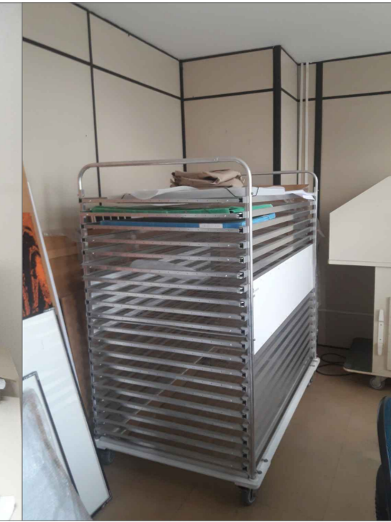
04 SECADORA DE DOCUMENTOS (1,30 x 0,70) H = 0,90