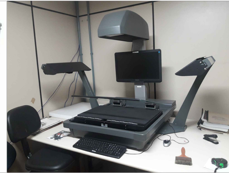
03 MESA SCANNER PLANETÁRIO (1,50 x 0,95) H = 0,75