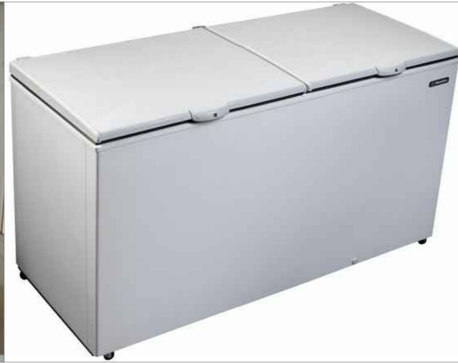
02 FREEZER (1,30 x 0,70) H = 1,45