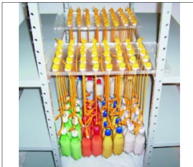
Figura 1. Foto do aparato para manter o balonete da sonda de Foley sob moderada tração e em contato com gaze seca ou lubrificada por diferentes formulações farmacêuticas.