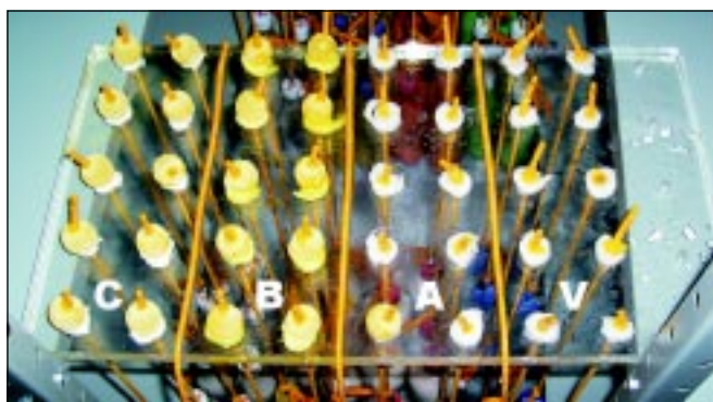
Figura 2. Foto do aparato, no quarto dia do experimento, que mostra nove e dez sondas de Foley rôtas nos grupos da pomada A (Iruzol®) e vaselina (V), respectivamente. Em contraste, sobre a mesma placa, as sondas em contato com a pomada B (Furacin®) e o creme C (Bactroneo®) permanecem íntegras.

rupturas foram precedidas por erosões macroscopicamente visíveis na superfície de alguns balonetes. Nas sondas de Foley remanescentes, nenhuma lesão macroscópica foi observada, e a massa mensurada, antes e após o experimento, manteve-se inalterada.