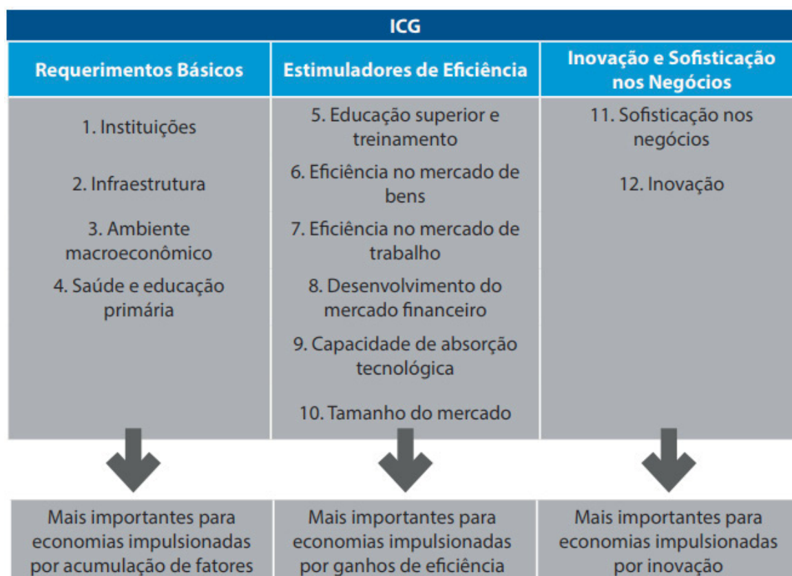
Figura 1 – Índice de Competitividade Global (ICG)