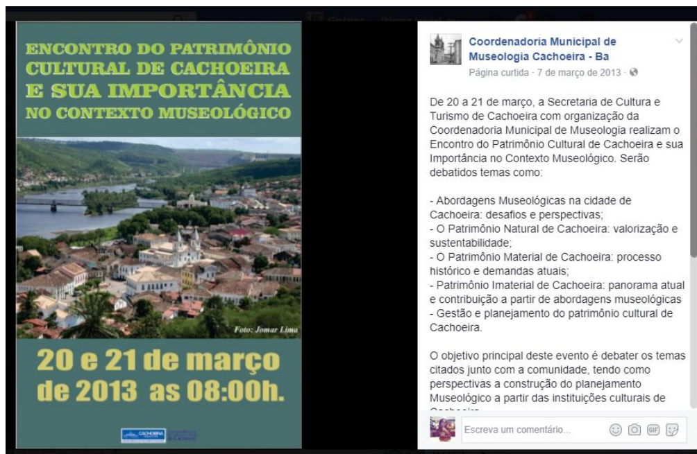
Figura 8 – Cartaz de Divulgação