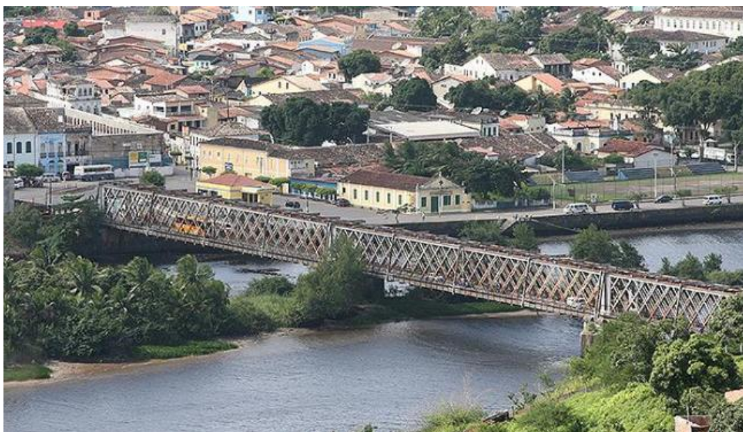
Figura 3 – Ponte D. Pedro II