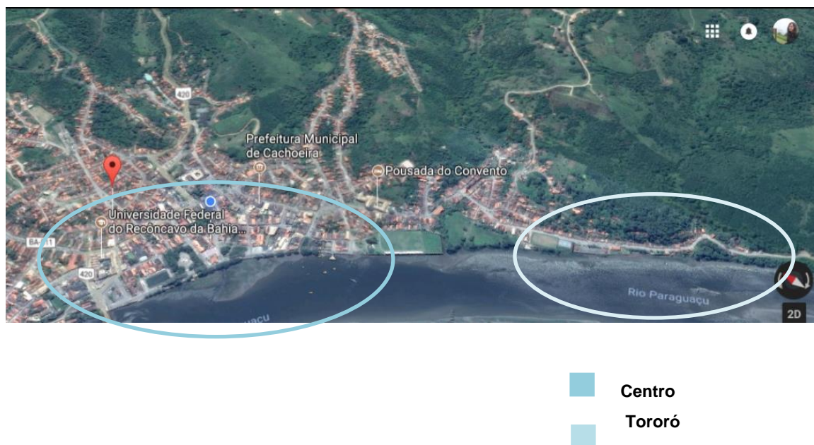
Figura 9 – Áreas