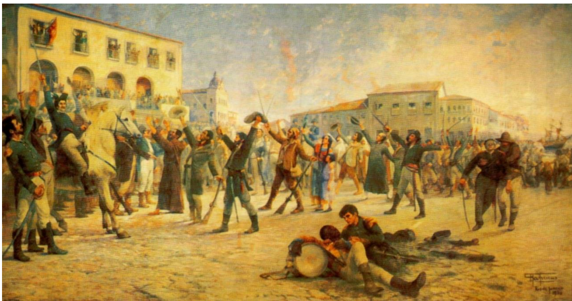
FIGURA 5 – Primeiro Passo Para A Independência – Óleo Sobre Tela Antônio Parreiras – Atualmente Sob A Guarda Do Palácio Rio Branco, Salvador Ba.