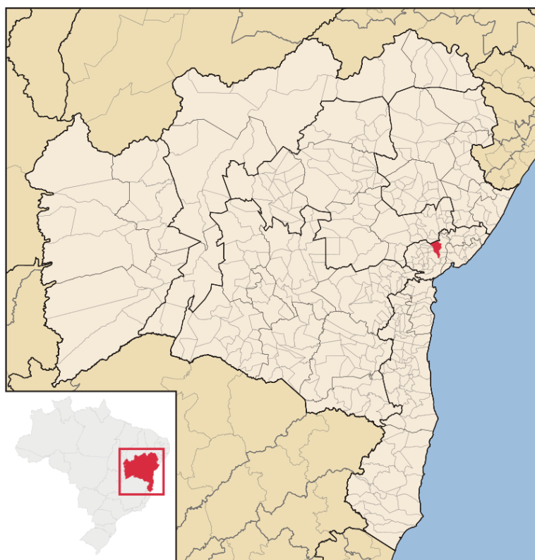
Figura 1 – Mapa da Bahia

Cachoeira é um município que está localizado no Recôncavo da Bahia, às margens do Rio Paraguaçu, a cerca de 120 km de Salvador. Com área formada por aproximadamente 395 km 2 , possui uma população 20 estimada em torno de 34 mil habitantes.