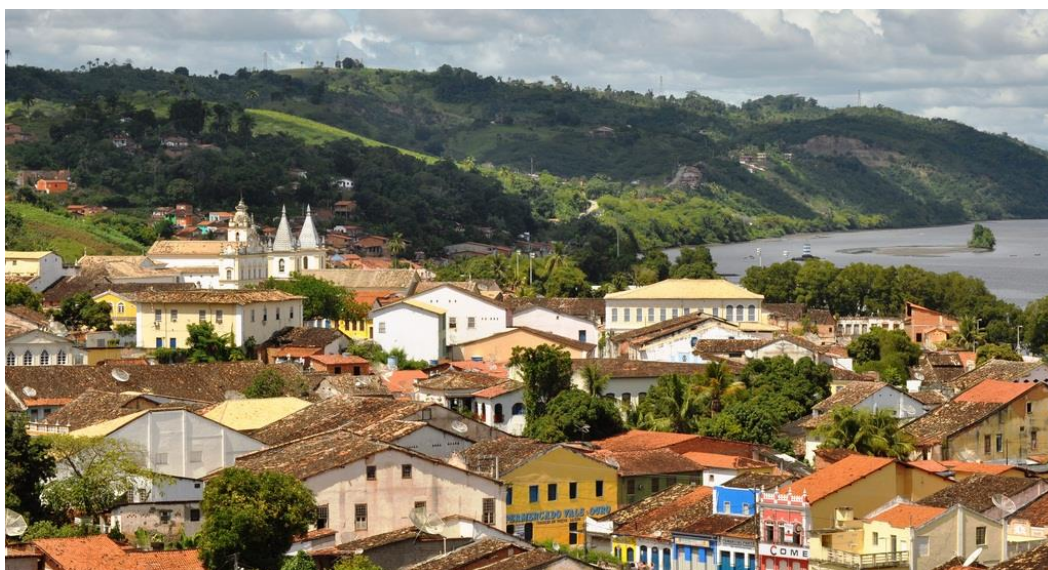
FIGURA 2 – Cachoeira Perímetro Urbano Central