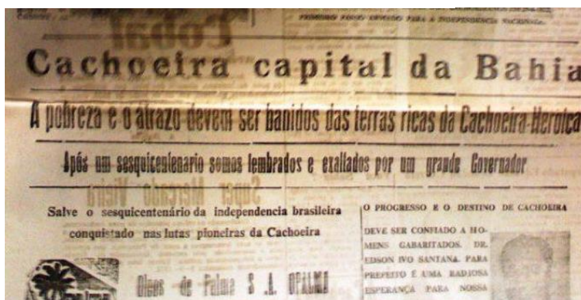
Figura 4 – Jornal "A Cachoeira", 05/07/1972