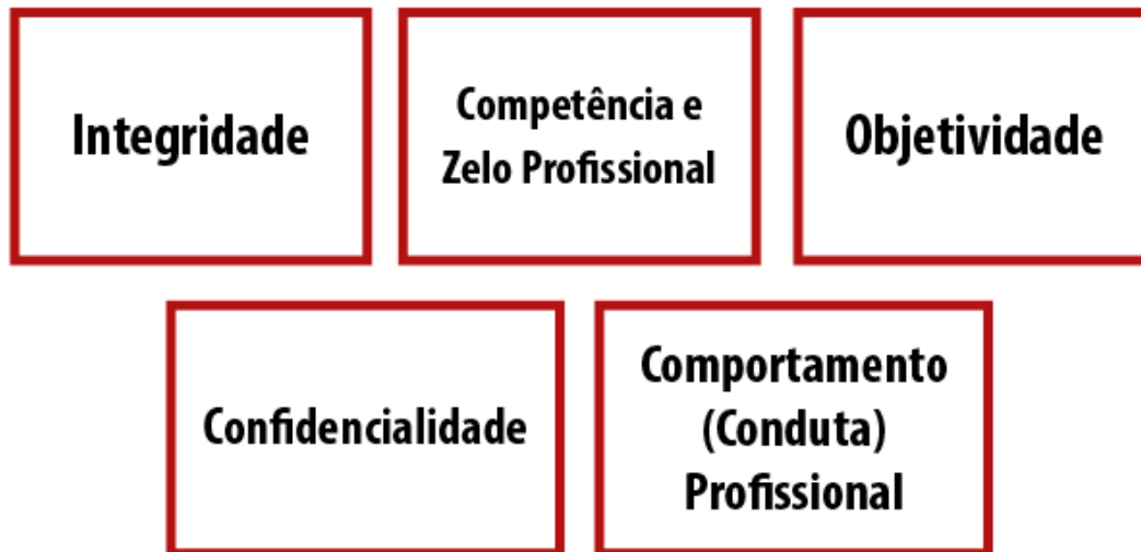
Figura 2: Código de ética do IFAC