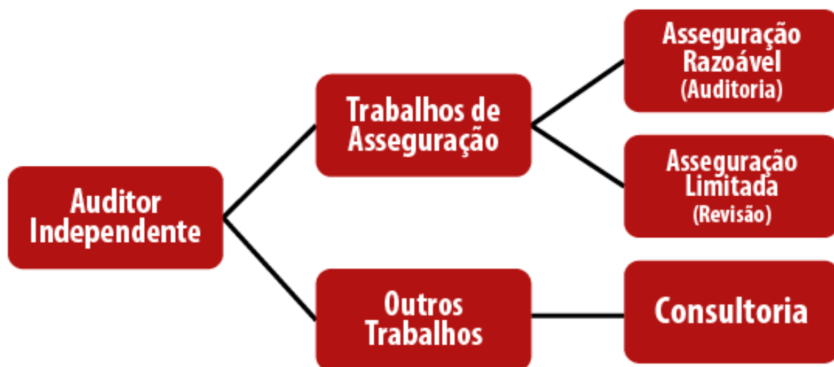
Figura 1: Trabalho de Asseguração do Auditor Independente

Agora, devemos atentar, pois nem todos os trabalhos executados por auditores independentes são trabalhos de asseguração. O exemplo clássico de um trabalho que o auditor independente executa, mas que não é de asseguração, é a Consultoria.