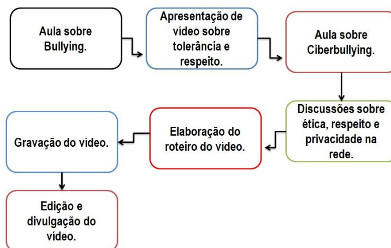
Figura 3: Processos de produção do vídeo.

A figura 1 apresenta a sequência de ações que fizeram parte dos processos para a produção do vídeo: