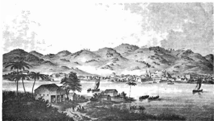
Cachoeira vista de São Félix, ca. 1825.

todos ocorreram no campo. Em 1827, pelo menos três revoltas escravas tiveram lugar: uma em Cachoeira, a 22 de março, uma em São Francisco do Conde, em abril, outra em Abrantes. Esta última tem sido descrita como uma série de ataques relâmpago e roubos levados a cabo por quilombolas. Nada mais se sabe. A de São Francisco foi séria, envolvendo os escravos dos engenhos Jacu, Canabrava, Boa Sorte, Retiro, Caju, Paciência, Água Boa, Pimentel, Felipe e Pandalunga, dez engenhos ao todo. Foi repelida com rapidez, mas desconheço os detalhes, tanto da rebelião como da repressão. 20