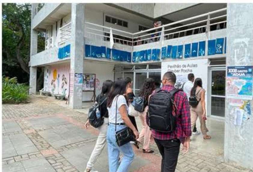
EXPOSIÇÃO CIANO-FOTOGRAMAS - CONGRESSO DA UFBA - MARÇO DE 2023.