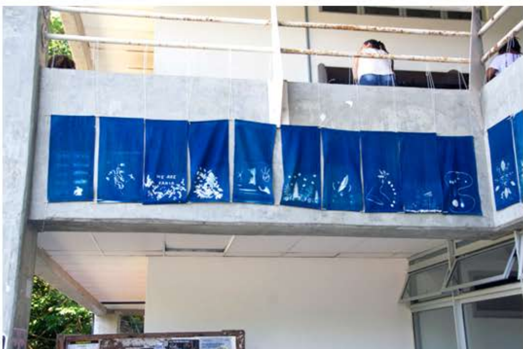
EXPOSIÇÃO CIANO-FOTOGRAMAS - CONGRESSO DA UFBA - MARÇO DE 2023.