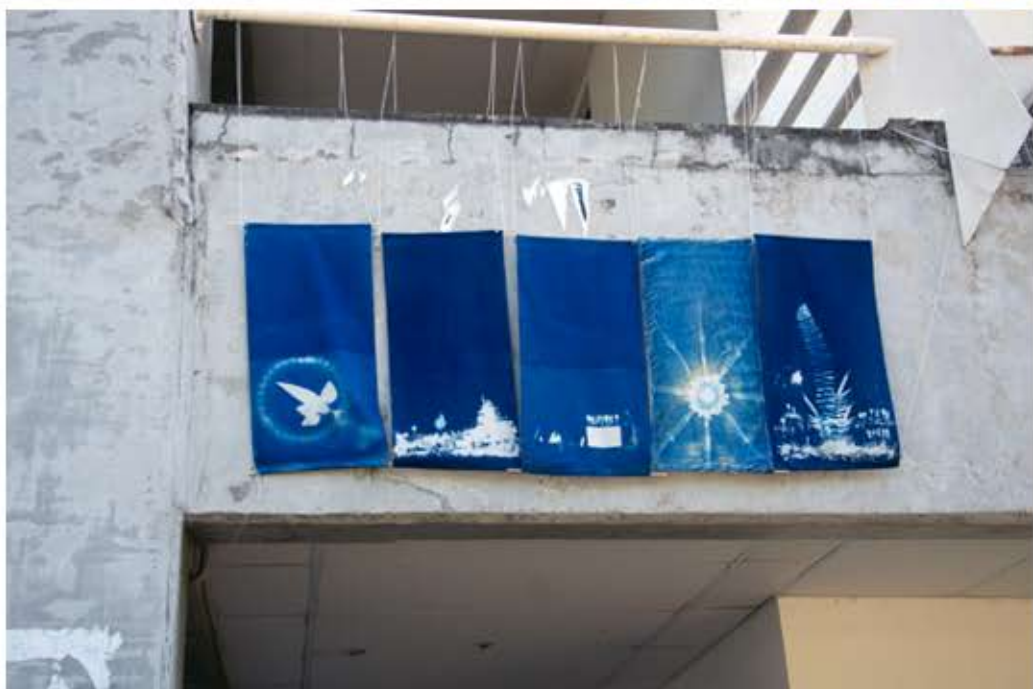
EXPOSIÇÃO CIANO-FOTOGRAMAS - CONGRESSO DA UFBA - MARÇO DE 2023.