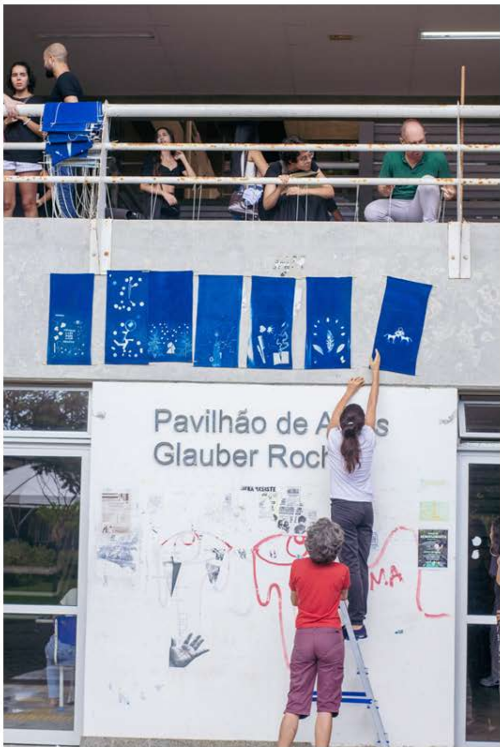
EXPOSIÇÃO CIANO-FOTOGRAMAS - CONGRESSO DA UFBA - MARÇO DE 2023.