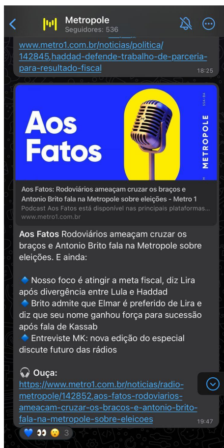
FIGURA 3 - Print Screen da mensagem do Aos Fatos no Canal do Whatsapp 8

Este capítulo foi dedicado a esmiuçar o podcast Aos Fatos. Foi apresentado como se deu o seu surgimento, modificações, relações com a Rádio Metropole - principal produto do Grupo Metropole - sua atual rotina de produção e estratégias de divulgação. O mais importante a ser notado e concluído é o processo de interação entre as mídias decidindo e criando um formato viável e adaptável.