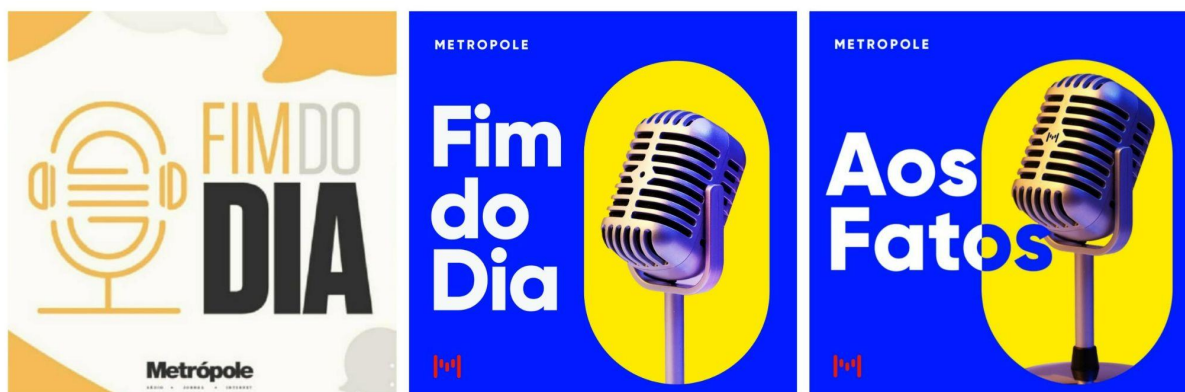
Figura 1 - Capas do Fim do Dia/Aos Fatos

China e queda de braço pela Embasa 6 , o Aos Fatos mudou de marca. (7'48"). Assim é até este momento.