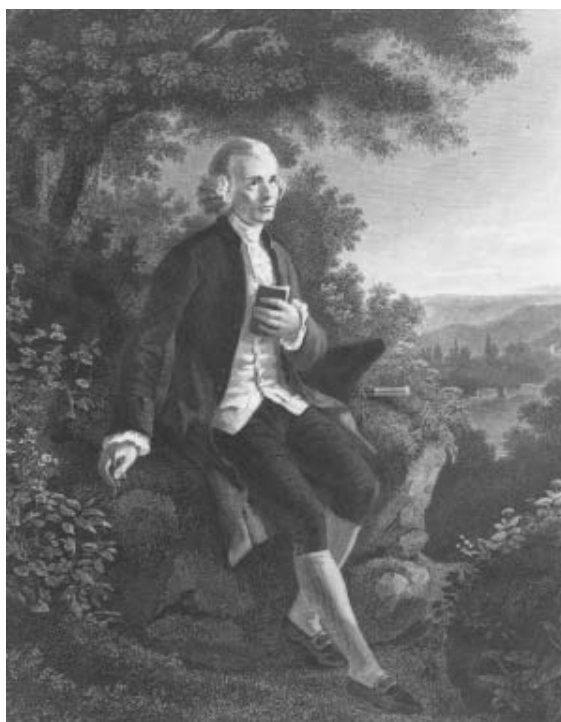
Figura 2: Imagem de Jean-Jaques Rousseau (1712-1778)