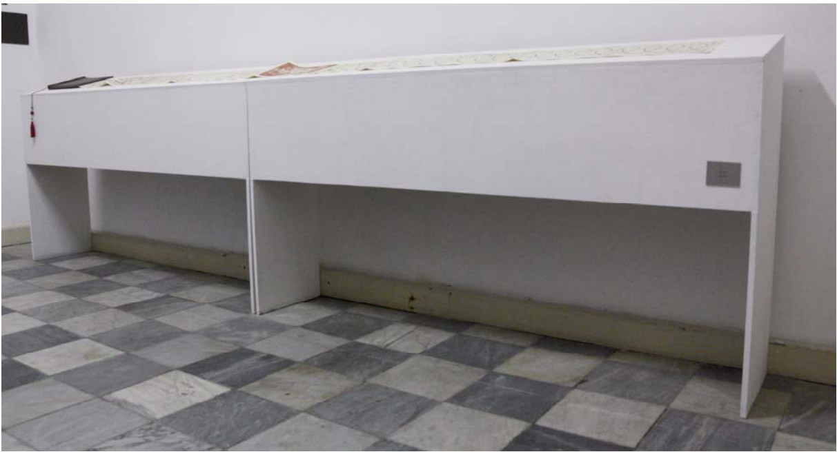
Detlaheš – O Livro