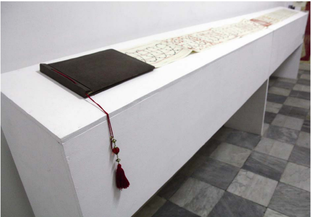
Obra 6 – O Livro