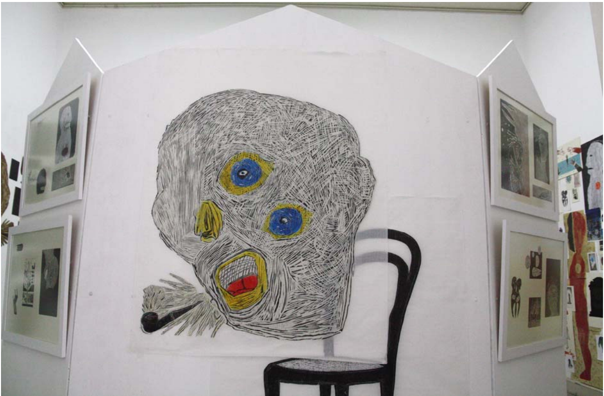
Obra 4 – O Copista