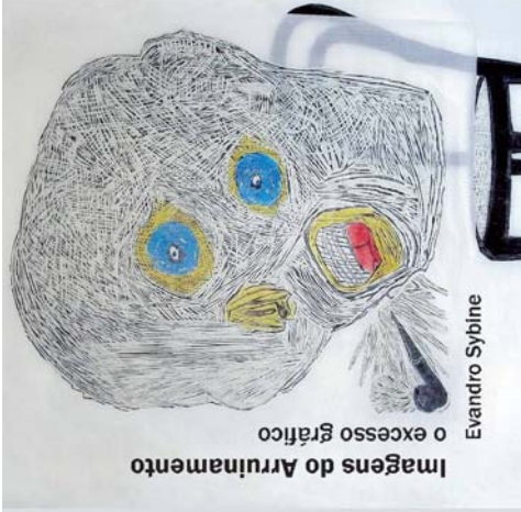
Imagens do Arruinamento o excesso gráfico Evandro Sybine