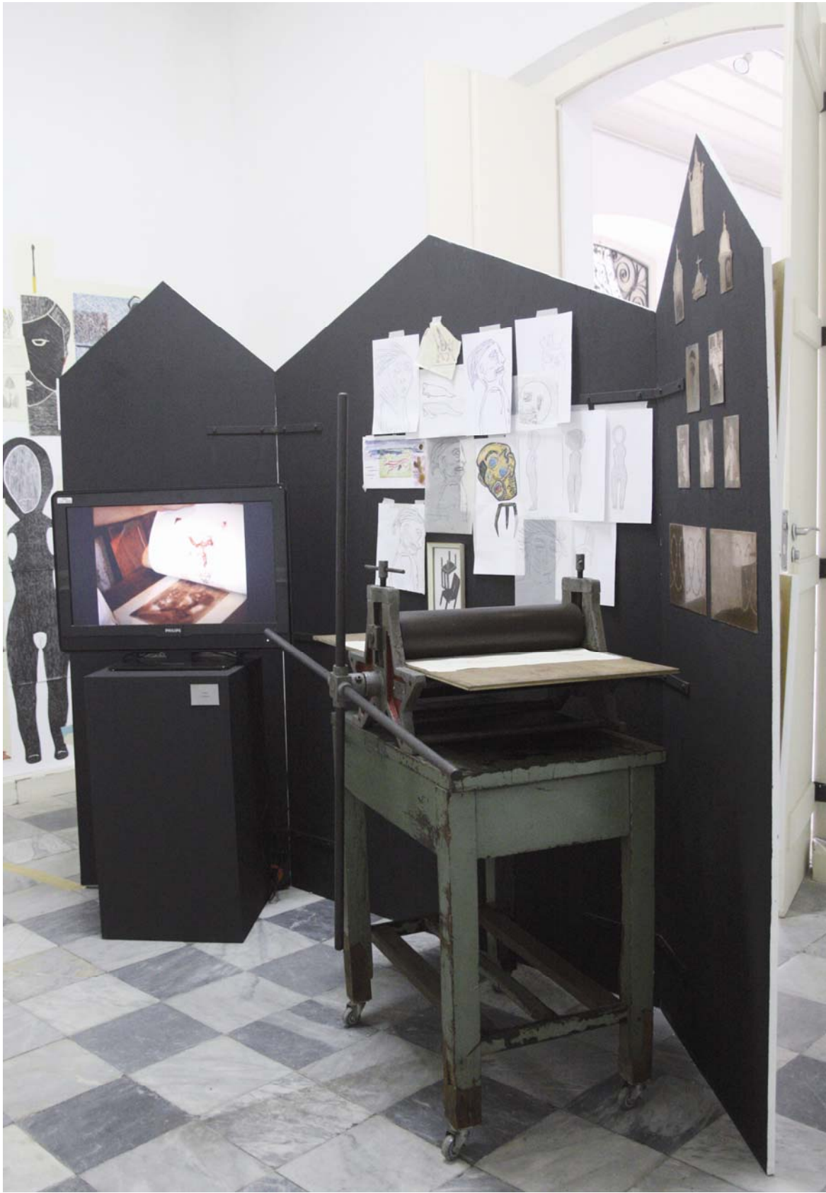
Obra 5 – O Gráfico