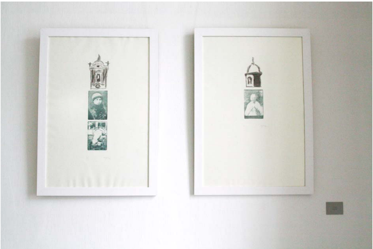
Obra 3 – As Ruínas