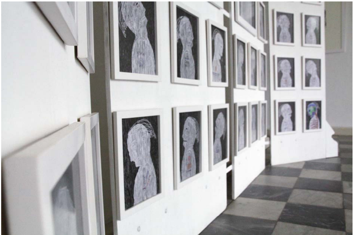
Detalhe – O Grande Duelo