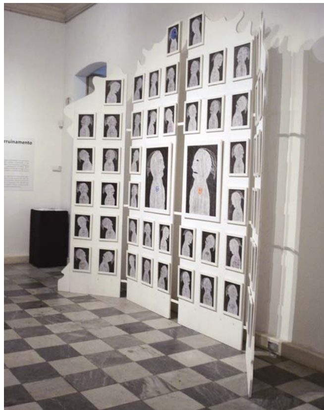
Obra 1 – O Grande Duelo