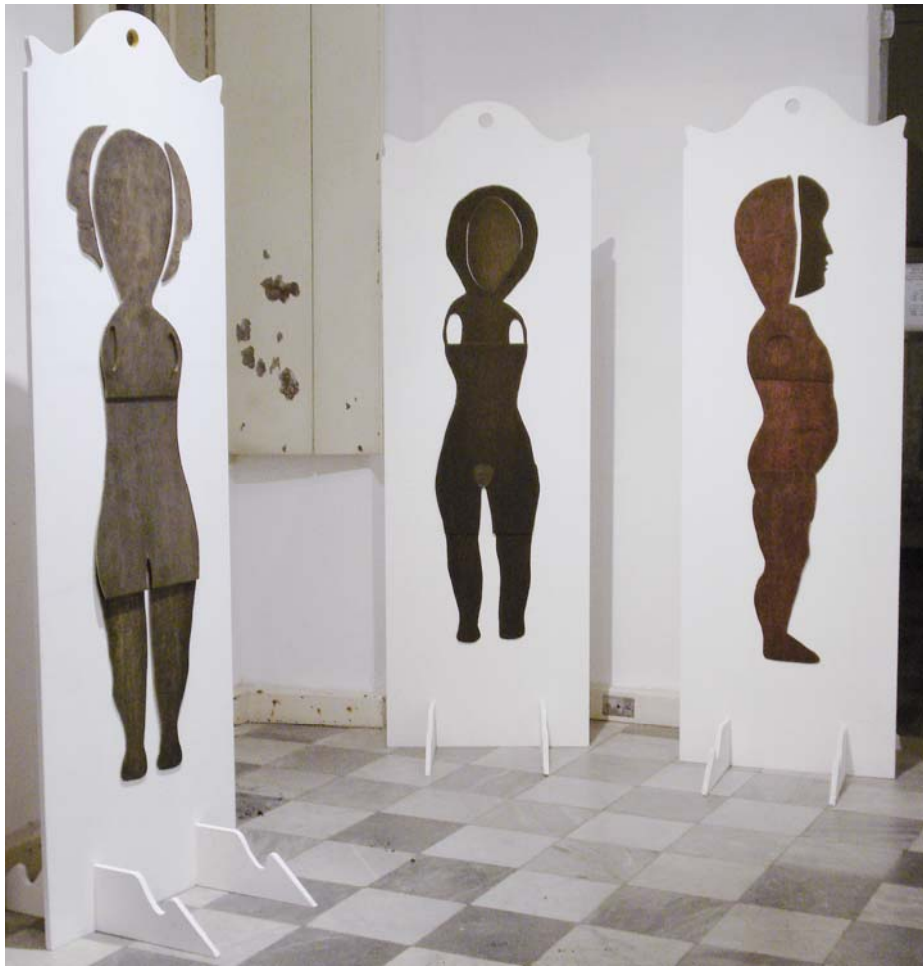
Obra 2 – S/ Título